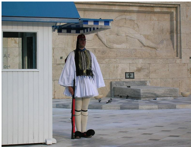
Evzone apsardze pie parlamenta ēkas, Atēnās, Grieķijā

Tiek piešķirta atļauja kopēt, izplatīt un/vai modificēt šo dokumentu saskaņā ar GNU Free Documentation License, versijas 1.2 vai jebkuras jaunākas Free Software Foundation publicētās versijas nosacījumiem