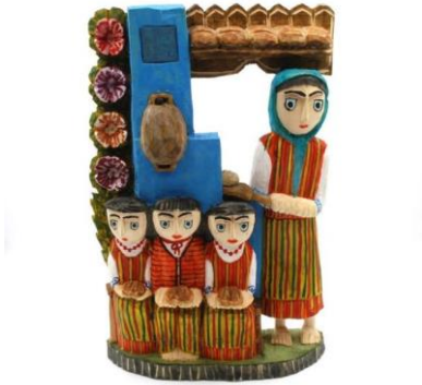
Ψήνοντας ψωμί/ πολωνική λαϊκή γλυπτική