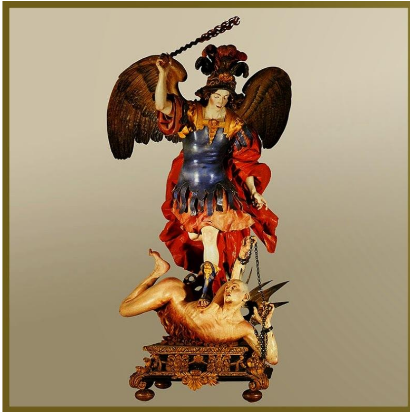
San Miguel de El Escorial. Δημιουργός: La Roldana

Παρά την επιτυχία της, η Ρολντάνα και ο σύζυγός της, επίσης γλύπτης, δεν βρέθηκαν ποτέ σε καλή οικονομική κατάσταση. Πέθανε μερικές μέρες αφού υπέγραψε τη δήλωση πτώχευσής της.