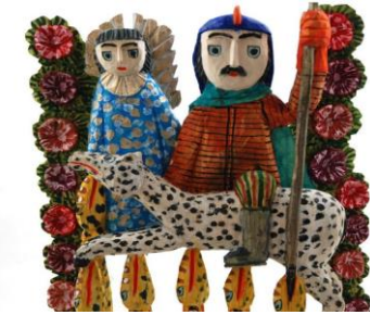
Ο άγιος Γεώργιος/ πολωνική λαϊκή γλυπτική