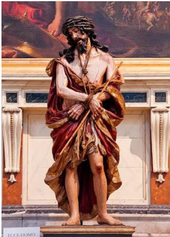
Ecce Homo . Δημιουργός: La Roldana

Το Ecce Homo (1684) του Καθεδρικού Ναού του Κάντιθ, είναι το πρώτο επίσημα αναγνωρισμένο έργο της Roldana. Αυτή η φιγούρα συγκεντρώνει μερικές από τις ιδιαιτερότητες του πρώτου σταδίου της γλύπτριας, όπως τους δραματικούς ρεαλισμούς που αντικατοπτρίζει το πρόσωπο του Ιησού, την προσοχή και τη φροντίδα στο σκάλισμα των μαλλιών, τα οποία διδάχθηκε στο ατελιέ του πατέρα του. Στην ίδια περίοδο ανήκουν και άλλα έργα όπως η Dolorosa de la Soledad (1688), ο Άγιος Ιωσήφ με το παιδί και ο Άγιος Ιωάννης ο Βαπτιστής ή η ομάδα της Αγίας Οικογένειας.