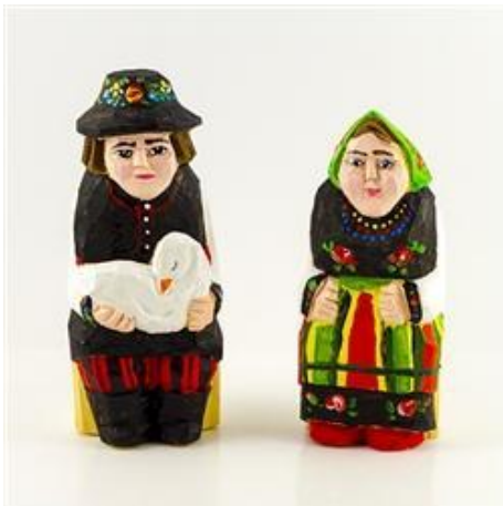
Σκαλιστό στο χέρι - Το ζευγάρι Lowicz www.polartcenter.com