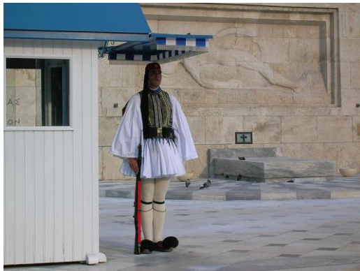
Εύζωνας σκοπός στην Ελληνική Βουλή, Αθήνα.

Το αρχείο είναι διαθέσιμο υπό τους όρους GNU Free Documentation License, Έκδοση 1.2 ή μεταγενέστερη