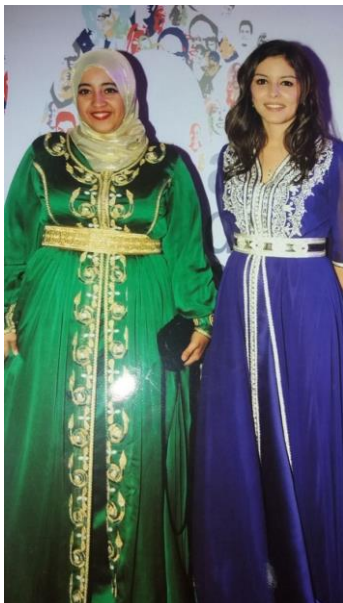
Tradycyjne marokańskie kaftany

W przypadku tradycyjnego stroju męskiego jest to również kaftan.