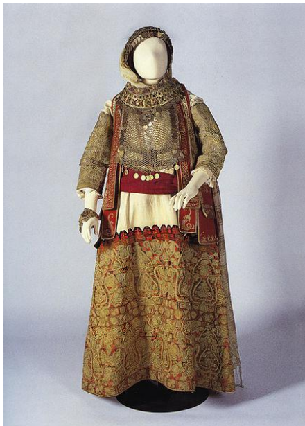
Traditional wedding costume of Greece (Tradycyjny strój weselny w Grecji)

This file is licensed under the Creative Commons Attribution-Share Alike 4.0 International licence.