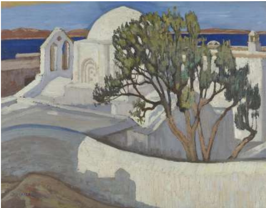
Pantanassa, Naxos par Konstantinos Maleas / Wikipedia Commons

Nous discutons de l'image et décrivons, avec l'aide des élèves, son paysage et les émotions que nous ressentons en la regardant.