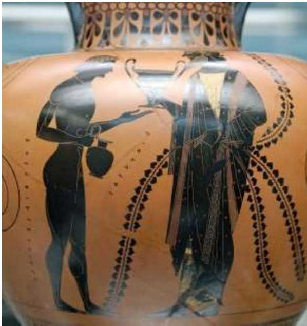
Dionysos Oinopion d'Exekias