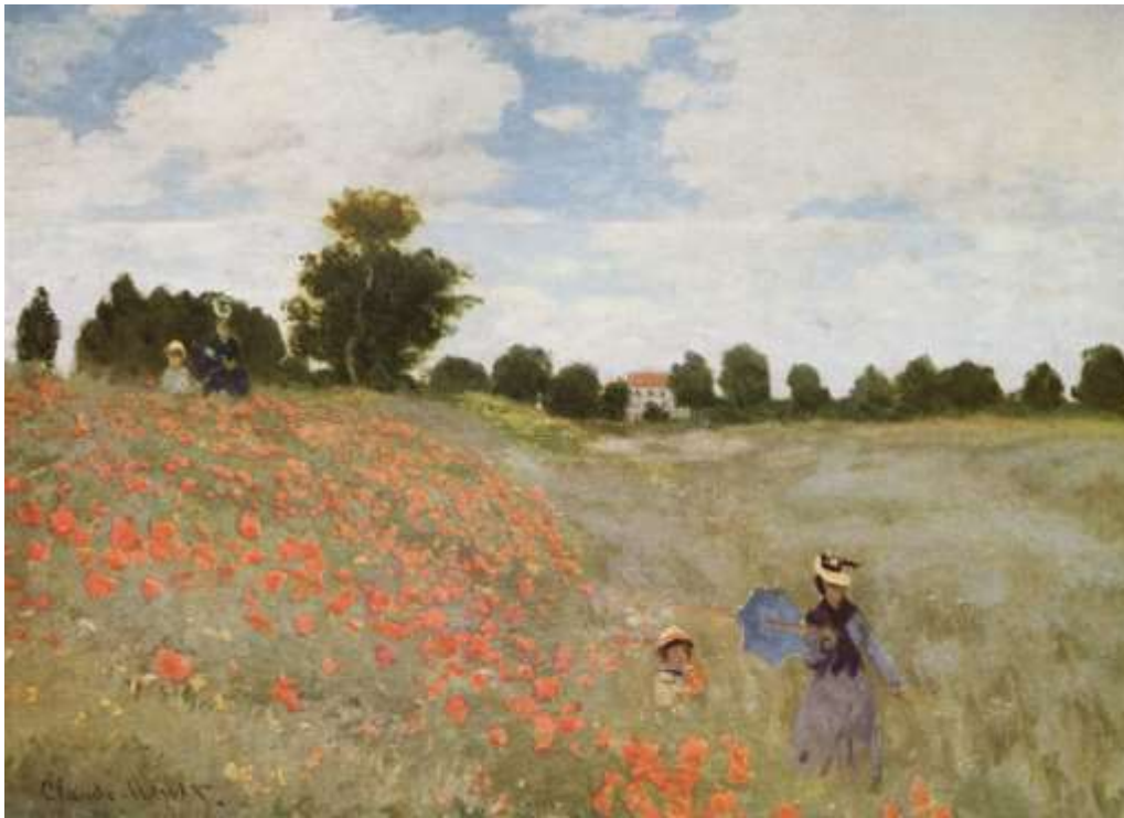
Coquelicots par Claude Monet