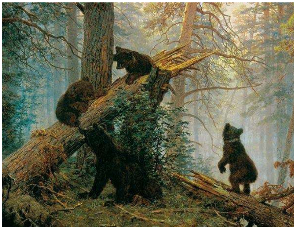
Matin dans la forêt de pins par Ivan Shishkin / Wikimedia Commons

Toute la famille d'ours est au premier plan. Une mère ourse et trois petits oursons sur un grand arbre tombé. On peut supposer qu'ils viennent de sortir du trou après une nuit de sommeil. Les oursons jouent joyeusement, tandis que la mère observe les environs et ses petits.