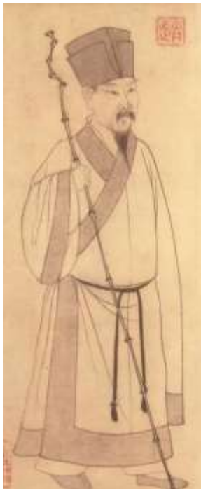
Su Shi par Zhao Mengfu / Wikimedia Commons

La peinture traditionnelle chinoise se distingue de la peinture européenne par le fait que l'image contient une inscription poétique ou de la poésie. Les maîtres exprimaient ainsi leur attitude à l'égard de leurs peintures et les signes s'ajoutaient au contenu. Un écrivain et artiste célèbre fut Su Shi, qui vécut au XI e siècle (8 janvier 1037 - 11 août 1101). Il s'est battu pour que la poésie accompagne toutes les peintures.