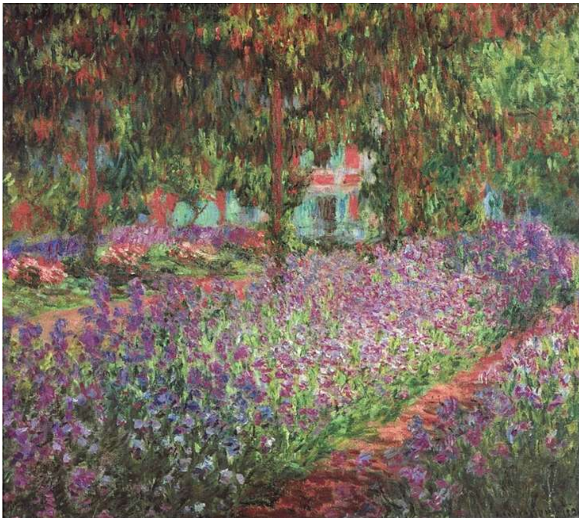
Le jardin de l'artiste à Giverny par Claude Monet