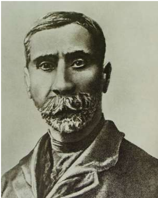
Niko Pirosmani

L'artiste géorgien Niko Pirosmani est né le 5 mai 1862 et mort le 7 avril 1918. Il était un artiste primitiviste géorgien. Ses œuvres appartiennent au mouvement artistique naïf. Il était autodidacte en peinture.