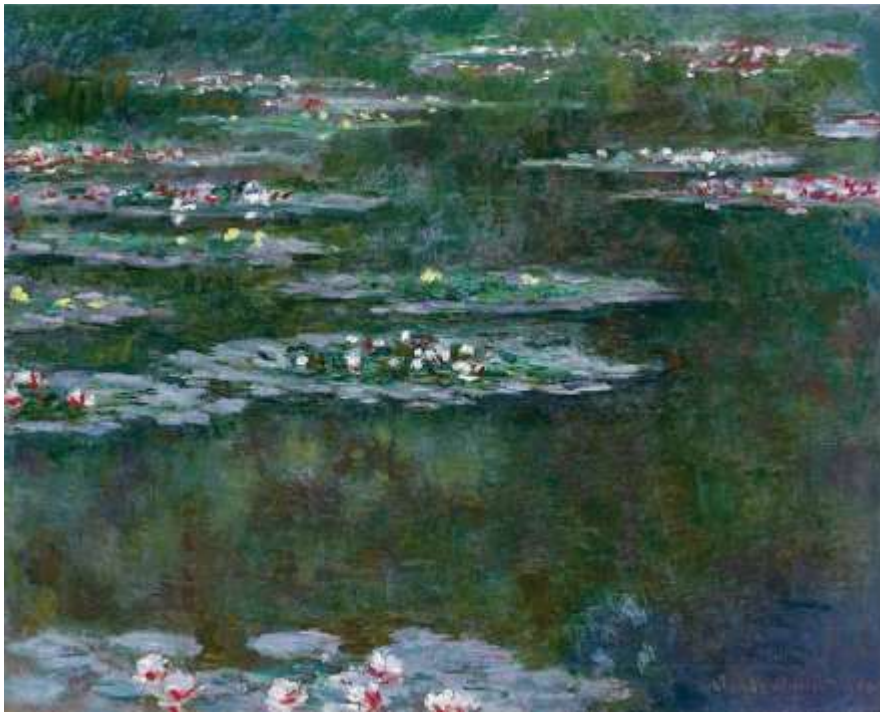
Nymphéas de Claude Monet / Wikimedia Commons