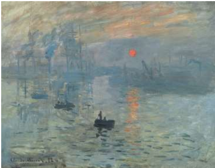
Impression, lever de soleil par Claude Monet

9. L'enseignant montre aux élèves l'image de la peinture de Monet et une discussion s'engage sur cette question : Quelles sont les caractéristiques des peintures de Monet ?