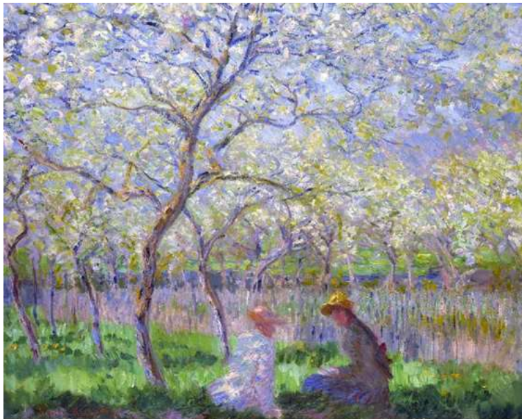
Le printemps par Claude Monet