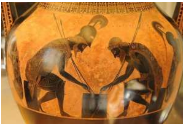
Achille et Ajax engagés dans un jeu par Exekias