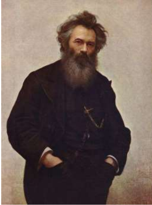
Portrait du peintre Ivan Shishkin par Ivan Kramskoj / Wikimedia Commons

Ivan Shishkin (1832-1898) était un peintre et critique d'art russe. Connu comme peintre paysagiste.