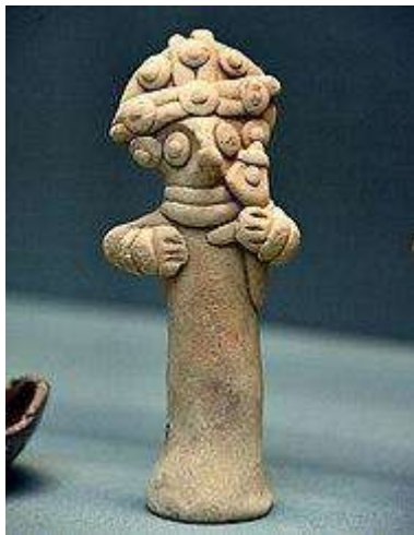
EU_SPF tenant un enfant de Karkemish. British Museum, Londres (n° de musée 108757). Ce fichier est placé sous la licence Creative Commons Attribution-Share Alike 3.0 Unported.

Les figurines de pilier syriennes de l'Euphrate (EU_SPF) sont des figurines anthropomorphes en argile datant de la fin de l'âge du fer (milieu du VIII e au VII e siècle avant notre ère) et produites dans la région de l'Euphrate moyen. Les figurines en argile sont entièrement fabriquées à la main et se tiennent debout. La forme du corps est concave à la base pour leur permettre de se tenir debout, les pieds peuvent être rendus par un morceau d'argile central en saillie au milieu de la partie frontale. Ils étaient généralement tenus d'une main, l'autre étant occupée à modeler les détails. C'est la technique dite du "bonhomme de neige", qui permet de travailler les figurines dans un espace tridimensionnel. L'objet est modelé tout autour, en préférant la partie inférieure du corps de la figurine comme base de soutien. Parmi les outils de modelage, outre les doigts, il convient de mentionner un bâton de bois pointu pour la caractérisation des traits anatomiques, en particulier des doigts, mais aussi des ornements particuliers. D'autres outils plus rarement utilisés sont les motifs floraux et les peignes.