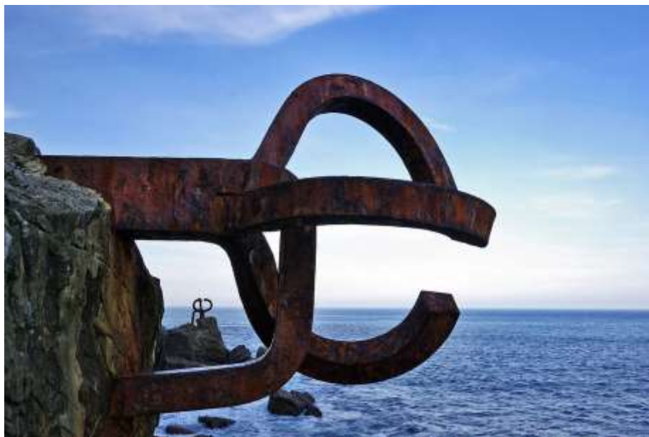
Peigne à vent par Eduardo_Chillida

L'une des œuvres les plus célèbres de Chillida, le Peigne du vent (1977), se trouve sur le front de mer de San Sebastián. Créée en collaboration avec l'architecte Luis Peña Ganchequi, elle se compose de deux griffes ou peignes en fer qui s'avancent dans la mer. La sculpture fusionne avec succès la férocité des vagues et la force des structures en fer pour créer une œuvre puissante.