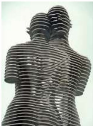
Roberto Strauss sur Flickr. Ce fichier est placé sous la licence Creative Commons Attribution-Share Alike 2.0 Generic.

"Man and Woman" est une sculpture mobile en acier de 8 mètres de haut réalisée par la sculptrice géorgienne Tamara Kvesitadze. Située dans la ville balnéaire de Batumi, en Géorgie, les deux personnages représentent un garçon musulman, Ali, et une princesse géorgienne, Nino, tirés d'un célèbre roman de 1937 de l'auteur azerbaïdjanais Kurban Said. Ali, un musulman azerbaïdjanais, tombe amoureux de la princesse géorgienne Nino, mais malheureusement, alors qu'ils sont enfin parvenus à se rencontrer, la guerre frappe le pays et Ali est tué. C'est ce célèbre amour qui a inspiré l'artiste géorgienne Tamara Kvesitadze pour créer sa sculpture monumentale en mouvement en 2010. L'œuvre d'art métallique géante, également connue sous le nom de "Statue de l'amour", se compose de deux figures quelque peu transparentes faites de segments empilés. Les deux statues se déplacent, changeant de position toutes les 10 minutes, jusqu'à ce qu'elles ne fassent plus qu'un. La nuit, les sculptures sont illuminées de couleurs changeantes, un spectacle d'une beauté magnétique.