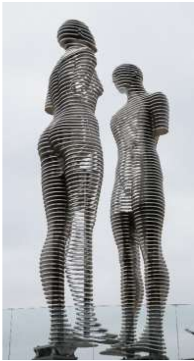
Cette image a été publiée à l'origine sur Flickr _ Joanne. Ce fichier est placé sous la licence Creative Commons Attribution-Share Alike 2.0 Generic.