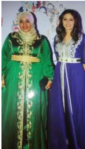
Kaftans marocains traditionnels Creative Commons Attribution-Share Alike 4.0

Dans le cas de la robe traditionnelle d'un homme, il s'agit également d'un kaftán.