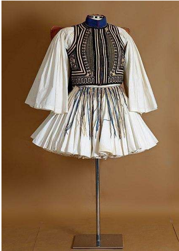
Costume de Tsolias

Ce fichier est placé sous la licence Creative Commons Attribution-Share Alike 4.0 International.