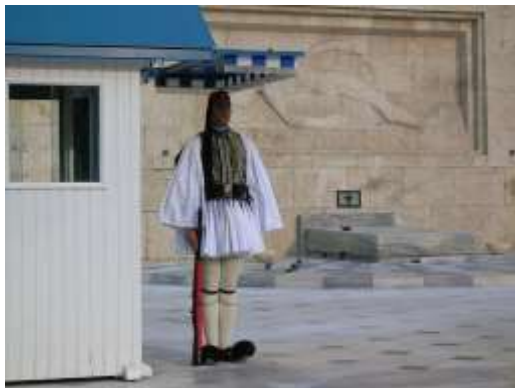
Garde de la Evzone devant le bâtiment du parlement, Athènes, Grèce.

Les étuis à cartouches, qui sont en cuir.