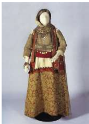
Costume de mariage traditionnel de Grèce

Les robes de mariée des femmes, en particulier, visaient à souligner la prospérité et la position sociale de la famille de la mariée. Le costume de mariage était conçu dans les moindres détails et sa mise en œuvre durait des mois. Il en résultait un ensemble sémantique de messages exprimés par des bijoux et des couleurs, des broderies, des éléments décoratifs et une combinaison de tissus et de textures. La seule caractéristique commune à toutes les régions de Grèce est que les costumes de mariage se caractérisent par leur exagération : les bijoux et les ornements complexes couvraient tout le corps de la mariée, ce qui rendait le costume particulièrement lourd, plus de 30 kilos. Après le mariage, le costume de la mariée était porté lors de toutes les fêtes et occasions officielles jusqu'à la naissance du deuxième enfant.